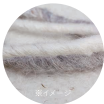
ケラチンフィルム

ナチュラルスタイルをスマートにつくれる 「ズレ」と「トメ」の両立を可能にした新設計。